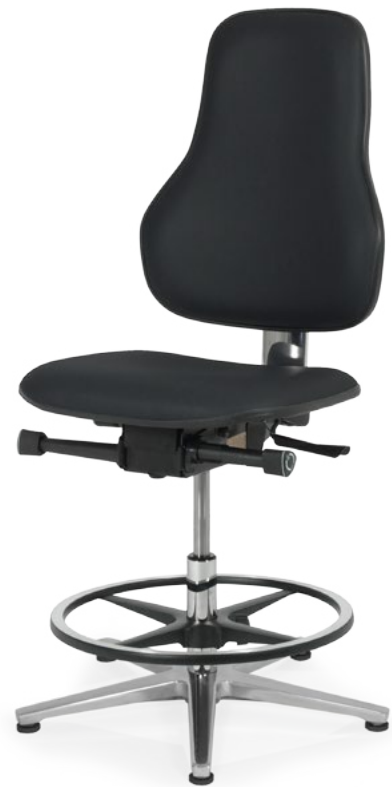
lux ESD K ST7 SH FK-G AH7

Das Spitzenmodell dieser Produktserie ist der lux ESD. Seine Rückenlehne ist höher als bei anderen Arbeitsstühlen, aber im Schulterbereich deutlich schmaler als bei Bürostühlen. Das stützt die obere Wirbelsäule und garantiert Schulterfreiheit für schnelles Greifen nach links, rechts oder hinten. Gleichzeitig wird der untere Rücken durch die dort breit ausgeformte Lehne optimal stabilisiert. Sitzfläche und Rückenlehne können sie einzeln an Ihre individuellen Bedürfnisse anpassen, wie bei allen folgenden Arbeitsstühlen auch.