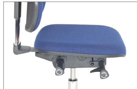
Details, lux Sitzträger asynchron (ST7)