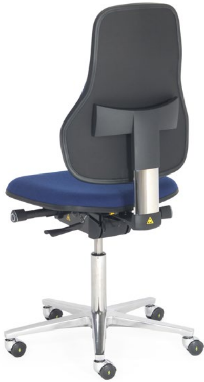
lux ESD S ST7 NH FK-R